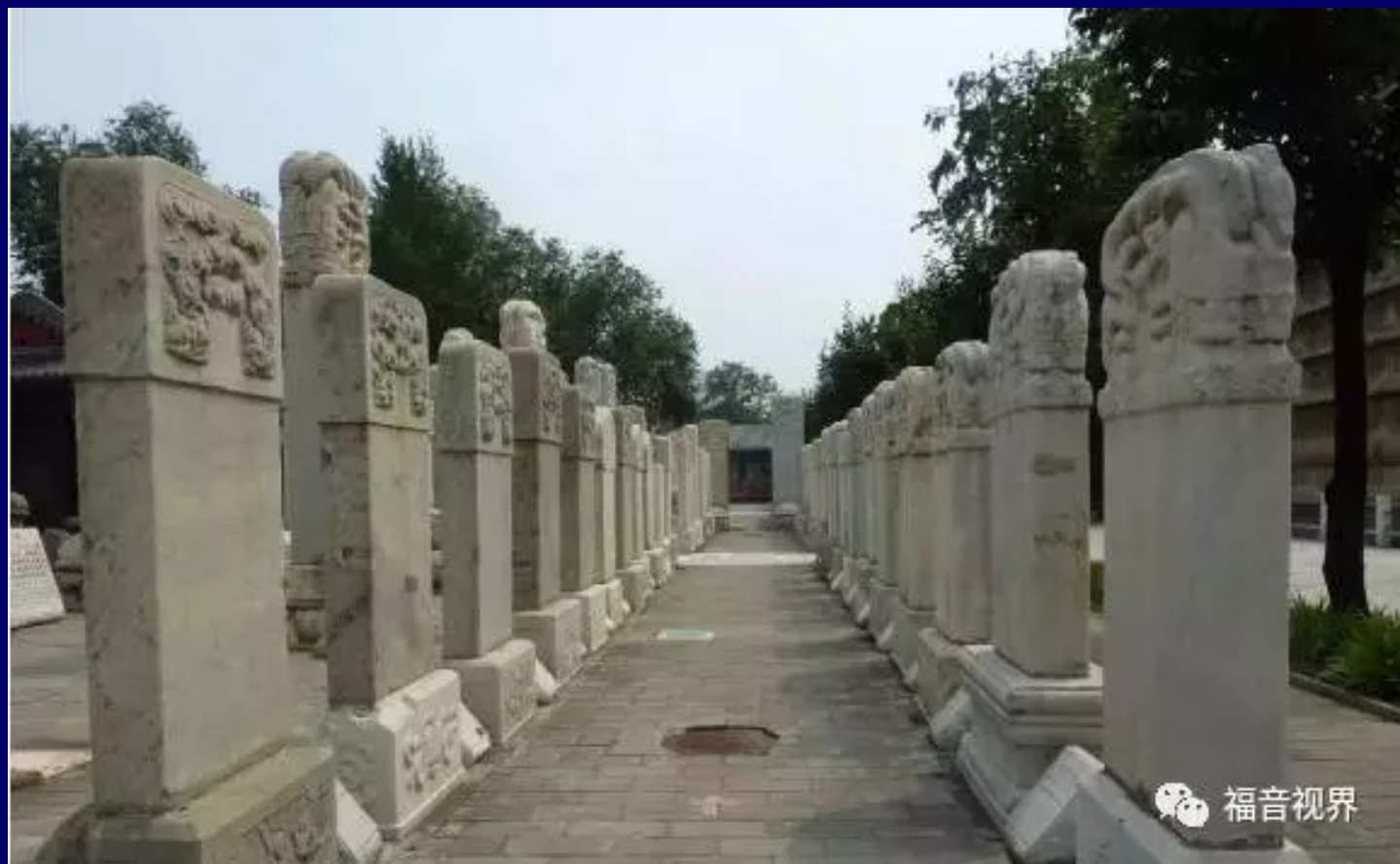
北京滕公栅栏墓地，全国重点文物保护单位：内有 66 座传教士墓

西方宣教士利玛窦（Matteo Ricci, 1552-1610）1583年来到中国，1605年在北京出版了《西字奇迹》等4篇汉字文章加了拉丁字母的注音。他是最早采用拉丁文字母为汉字注音的人。