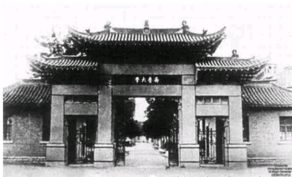
登州文会馆成为齐鲁大学的前身

基督教大学在中国的出现是在1880年前后，当时的大学主要是在教会中学基础上添加的大学班级。 基督教在华的第一所大学是美国长老会在山东登州开办的登州文会馆。