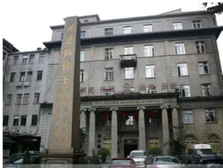
伯驾在十三行新豆栏街(应现十三行路)创办眼科医局

伯驾（Peter Parker） 1804年生于马萨诸塞，1831年毕业于耶鲁大学，1834年被美部会派遣来华，成为基督教第一个来华传教医生。1835年11月4日，他在广州新豆栏街7号的丰泰洋行内租屋开设“广州眼科医局”（Canton Ophthalmic Hospital），又称“新豆栏医局”。这是中国第一所新式教会医院，西医自此正式传入中国。